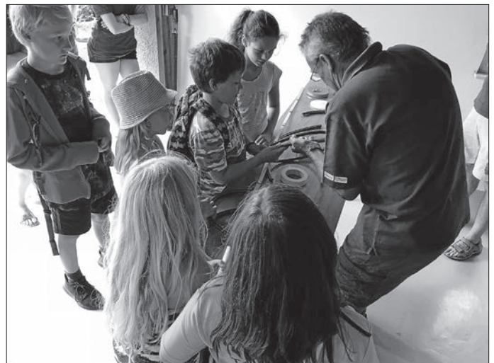
Wir basteln eine Gartenschlauch-Trompete