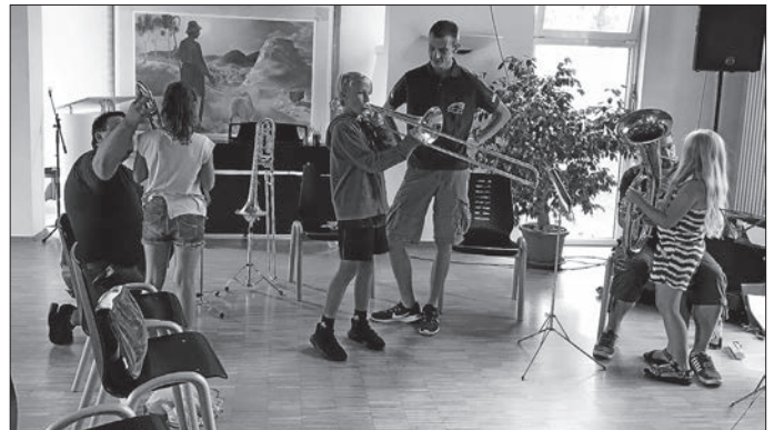
Das Großblech wird ausprobiert