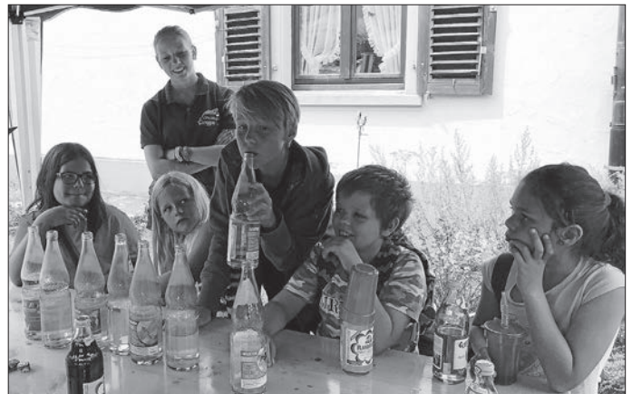
„Alle meine Entchen“ auf der Flaschen-Flöte

Ein großes Dankeschön an die Quodlibet-Forscher. Ihr wart ein tolles Team und es hat uns allen viel Spaß gemacht mit euch zusammen zu musizieren.