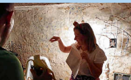
Stadtführungen in Tengen