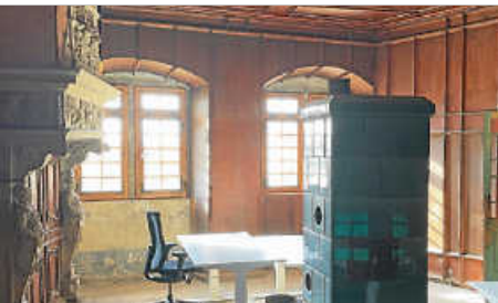
Summer of Pioneers Schloss Blumenfeld