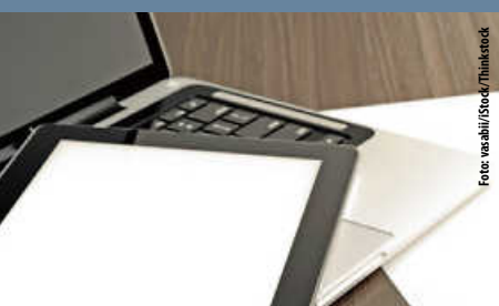
Stellenausschreibung des Bürgermeistervorzimmers