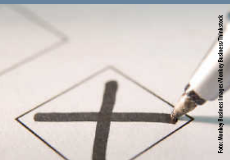
Aufruf zur Schöffenwahl