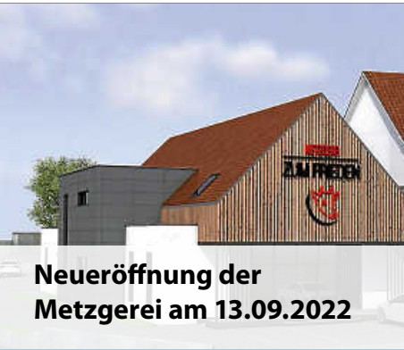
Neueröffnung der Metzgerei am 13.09.2022