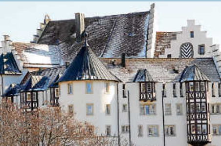
Tag des offenen Denkmals