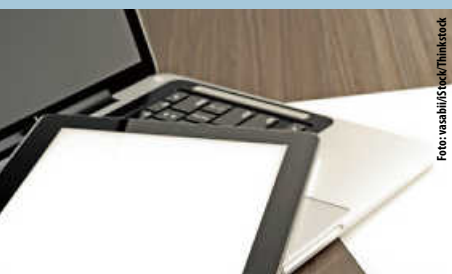
Generalversammlung Ärztehaus Stadt Tengen eG