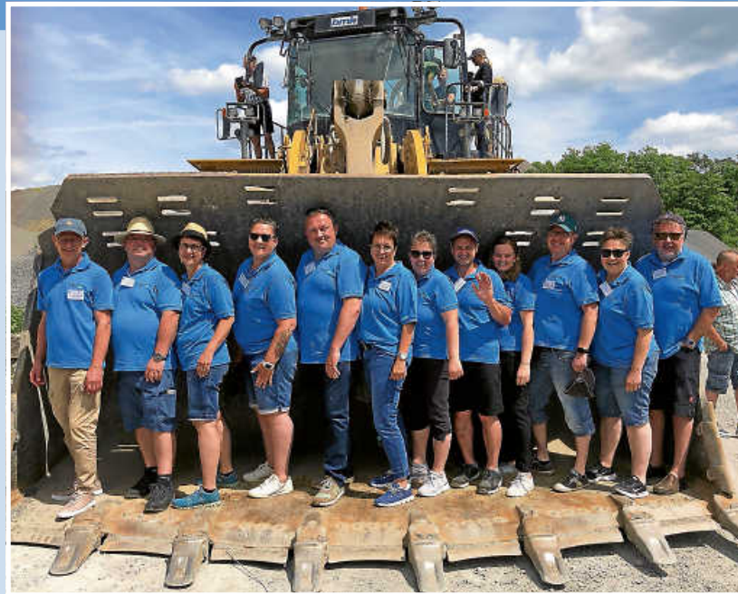
Delegation 2022

vom 20. - 22. Mai. fand das 61. int. T(h)alheim-Treffen in Talheim im Kreis Heilbronn statt. Von diesen Talheim bzw. Thalheim aus Deutschland, Österreich, der Schweiz und Rumänien treffen sich alljährlich so zwischen 15 und 20 Gemeinden bei einem anderen Gastgeber. Seit 1969 ist unser Talheim-Tengen mit in dieser internationalen Gemeinschaft ohne Unterbrechung dabei und durfte dieses Treffen bereits vier Mal ausrichten. In diesem Jahr konnten wir mit einer Delegation von 12 Personen teilnehmen.