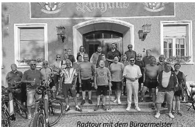
Radtour mit dem Bürgermeister