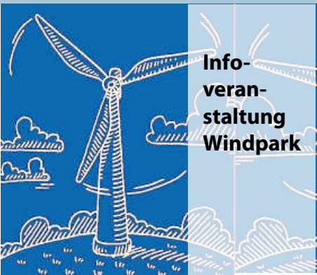
Info- veranstal- tung Windpark