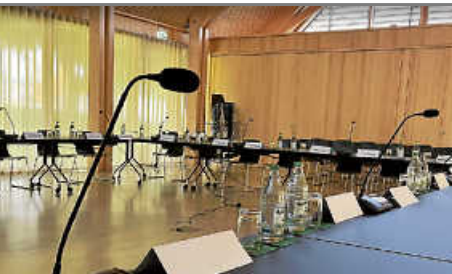
Gemeinderatssitzung am 27.07.2023