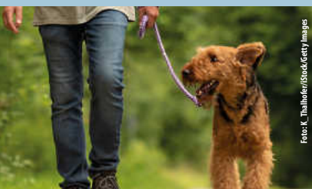
Infos aus dem Ordnungsamt