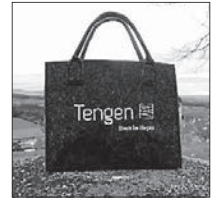
Filztasche 11,90 €