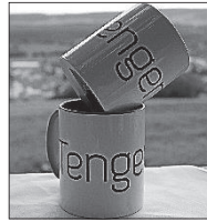
Tasse 8,00 €