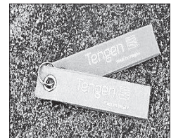
Filzanhänger 1,50 €