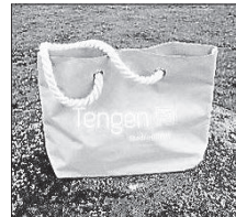
Strandtasche 11,90 €