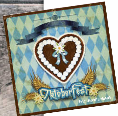
Plakat: Sabine Mützel

www.mv-wiechs.de www.facebook.com/mvwiechs www.instagram.com/mvwiechsamranden