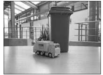
Bei der Bioabfalltonne gilt – je weniger Feuchtigkeit, desto weniger Probleme.