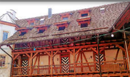
Tag des offenen Denkmals am 10.09.23