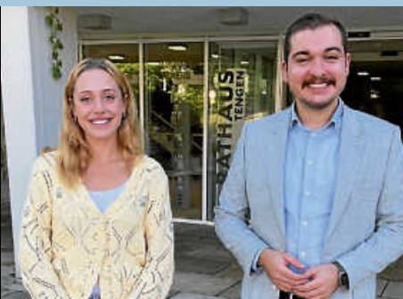
Viele neue Gesichter bei der Stadt Tengen