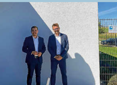
Zu Gast bei der Firma Stahl