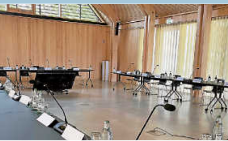
Gemeinderatssitzung am 21.09.2023