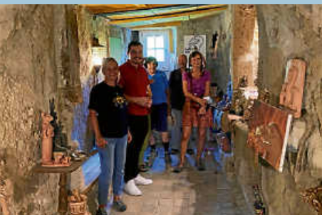
Tag des offenen Denkmals