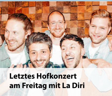
Letztes Hofkonzert am Freitag mit La Diri