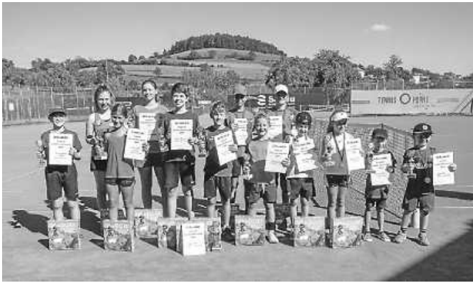
Finalisten der Jugend