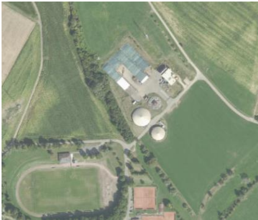
Abbildung 2: Luftbild

Direkt gegenüber des Betriebsgeländes befindet sich ein Sondergebiet mit Sportanlagen und Campingplatz. In direkter Nachbarschaft befinden sich ansonsten nur Wiesen und Ackerflächen.