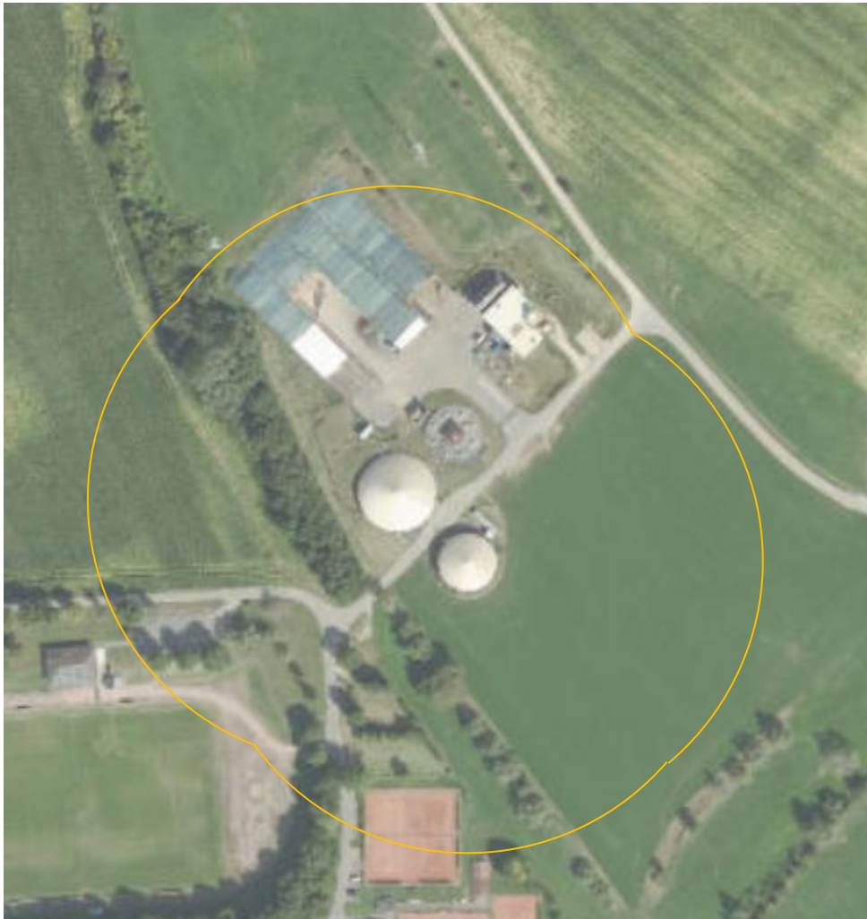
Abbildung 4: Schematische Darstellung der Umhüllenden derzeit

Diese Formulierung betrifft explizit Änderungsgenehmigungsverfahren nach dem BImSchG. Zwar ist die Anlage im derzeitigen Zustand nicht im Anwendungsbereich der Störfallverordnung, dennoch kann aufgrund der gehandhabten Stoffe und Lageranlagen auch für den Ist-Zustand ein angemessener Sicherheitsabstand berechnet werden, der ein Maß dafür sein kann, ob sich die Gefährdung des nächstgelegenen Schutzobjekts signifikant erhöht. Hierzu werden die o.a. Berechnungsergebnisse verwendet, aus denen ein angemessener Sicherheitsabstand von ca. 100 m für den Ist-Zustand hervorgeht. In nachfolgender Abbildung 4 ist die Umhüllende dargestellt.