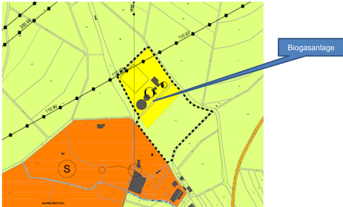
Abbildung 1: FNP-Auszug

Direkt gegenüber des Betriebsgeländes befindet sich ein Sondergebiet mit Sportanlagen und Campingplatz. In direkter Nachbarschaft befinden sich ansonsten nur Wiesen und Ackerflächen.