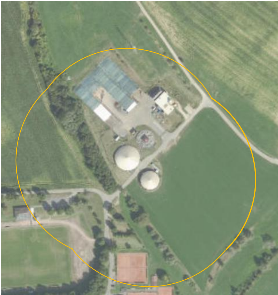
Abbildung 3: Schematische Darstellung der Umhüllenden