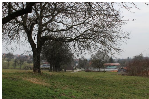
Blick entlang des Südrandes des Streuobstbestandes im Südwesten des FlSt. 3667. (März 2023)