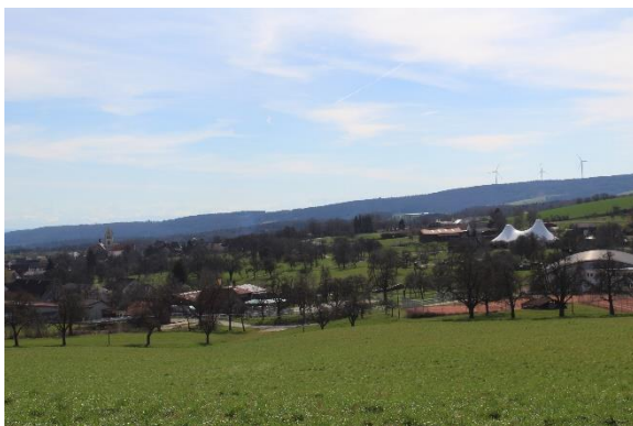
Blick von Norden des FlSt. 3667 nach Süden, über den Streuobstbestand. Im Hintergrund zu sehen ist der Turm der Pfarrkirche St. Laurentius. (März 2023)