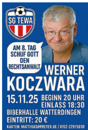
Plakat: SG TeWa

Rechtsanwalt“ ist ein Wunder, so die „Schwäbische Zeitung“, denn „wie kann man über ein scheinbar trockenes Thema wie Justiz ein derart komisches Kabarett machen?“