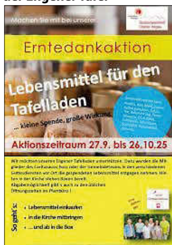
Erntedankaktion Plakat: SE Oberer Hegau

Wir freuen uns auf Lebensmittel wie Nudeln, Reis, Mehl, Zucker, gemahlenen Kaffee, Kakao, Tee, Babynahrung, Tomatensauce, Öl und H-Milch. Auch dürfen Hygieneartikel wie Zahnpasta, Zahnbürste, Spülmittel, Waschmittel und Windeln gespendet werden. „Mit dieser Aktion möchten wir die Menschen in unserem Gebiet zur Solidarität mit denen aufrufen, die nicht so viel zum Leben haben und über die Tafel Unterstützung erhalten.“ Die Aktion verläuft wie letztes Jahr: Wer von den genannten Lebensmitteln etwas spenden möchte, kann diese in einen der Gottesdienste, die im Aktionszeitraum in der Seelsorgeeinheit stattfinden, mitbringen. Wir vom Caritasausschuss oder Mitglieder der Gemeindeteams stellen Boxen bereit, in die man die Spenden legen kann. Auch außerhalb der Gottesdienste besteht die Möglichkeit, die gespendeten Lebensmittel abzugeben. Zu den Öffnungszeiten des Pfarrbüros stehen dort ebenfalls Boxen für die Spenden bereit.