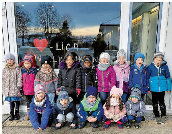
Watterdinger Wackelzähne in der Schule

Nach so viel Konzentration freuten sich die Kinder über eine ausgiebige Pause auf dem Pausenhof mit Essen, Bewegung und viel Spaß. Der Besuch war für alle ein tolles Erlebnis. Ein herzliches Dankeschön gilt den ersten Klassen und ihren Lehrkräften, die diesen gelungenen Vormittag ermöglicht haben. Herzliche Grüße vom Kita-Team Watterdingen