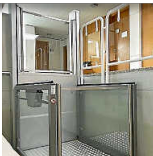
Neuer Plattformlift im Rathaus Tengen eröffnet