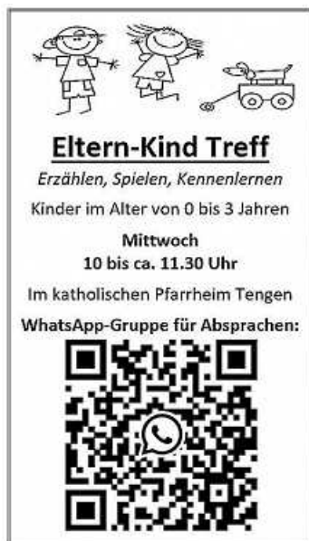
Plakat: Kirchengemeinde Tengen