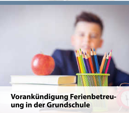
Vorankündigung Ferienbetreu- ung in der Grundschule