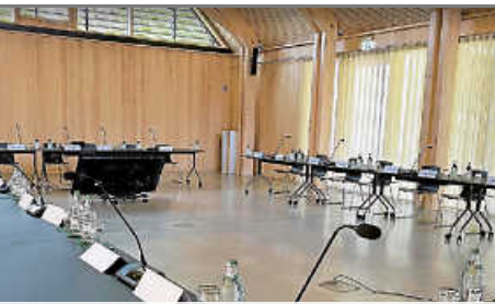
Gemeinderatssitzung am 26.02.2026