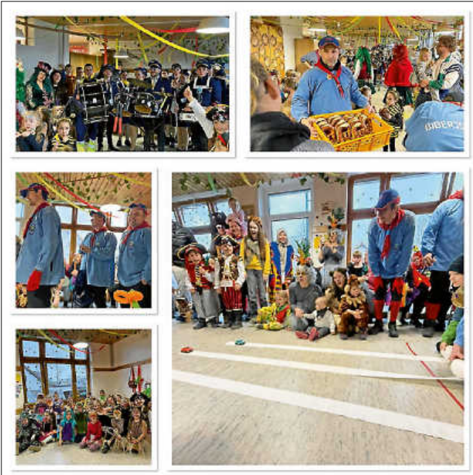
Schmutziger Donnerstag in der Kita Watterdingen

Narri, Narro vom närrischen Kita-Team Watterdingen