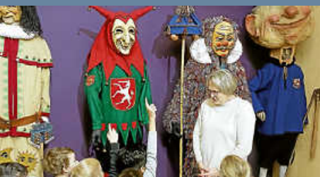
Ausflug der Vorschulkin- der ins Faschnachtsmuseum Schloss Langenstein