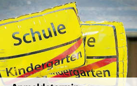
Anmeldetermin für die Einschulung 2026