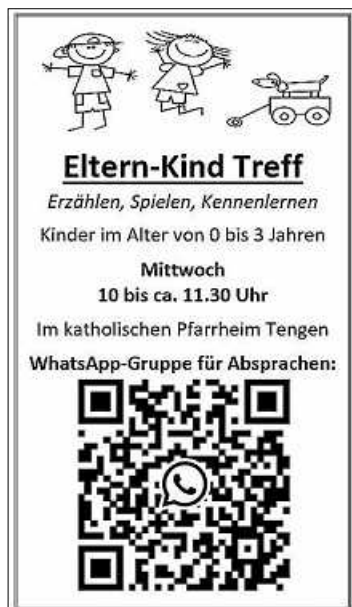
Plakat: Kath. Kirchengemeinde Tengen