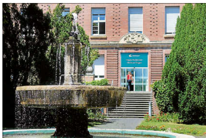
Haupteingang Hegau-Bodensee Klinikum

Mit der Wiedereröffnung des Haupteingangs wird nun ein weiterer Bauabschnitt abgeschlossen: Information und Anmeldung, Zentrale Notaufnahme, stationäre Aufnahme und DCU befinden sich künftig in direkter räumlicher Nähe. Dies erleichtert die Orientierung für Patienten und unterstützt eine reibungslose interdisziplinäre Zusammenarbeit.