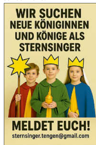
Plakat: Kath. Kirchengemeinde Tengen

In den anderen Orten werden die Vortreffen noch mitgeteilt. Für Watterdingen meldet Euch gerne unter Tel 7858, für Blumenfeld und Weil unter sternsinger.blumenfeld.weil@outlook.de und für Büßlingen und Beuren unter sternsinger.buesslingen.beuren@outlook.de .