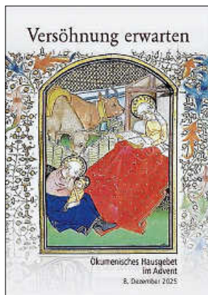
Plakat: ACK BW

Dieses Hausgebet ist für viele Menschen inzwischen zu einer wertvollen Tradition in der Adventszeit geworden. Sie feiern gemeinsam als Familie, unter Freunden und Bekannten, als Nachbarschaft, in Gruppen und Kreisen auch über die Konfessionsgrenzen hinweg.