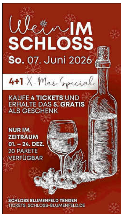
Plakat: Schloss Blumenfeld