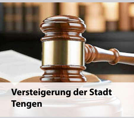
Versteigerung der Stadt Tengen