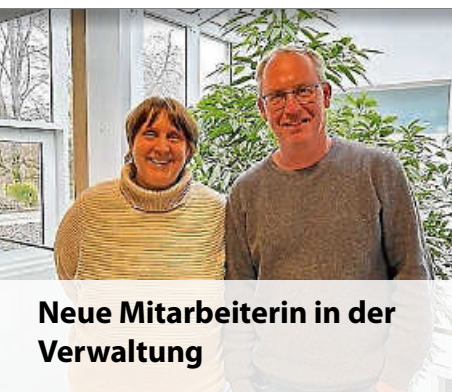
Neue Mitarbeiterin in der Verwaltung