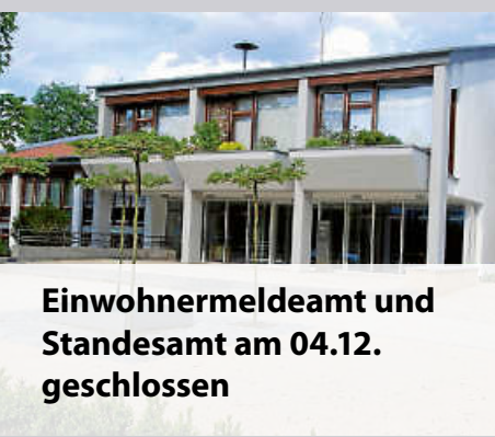
Einwohnermeldeamt und Standesamt am 04.12. geschlossen