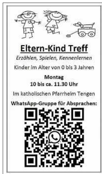
Plakat: Kath. Kirchengemeinde Tengen