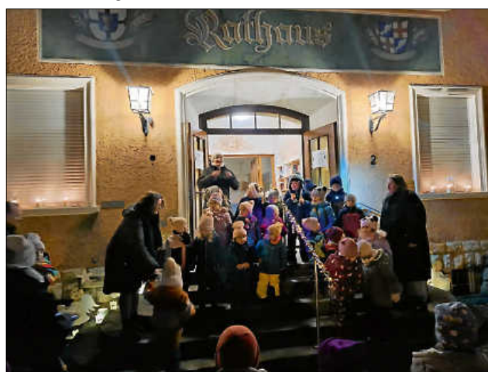
Kinder der Kita Watterdingen singen

Adventliche Lichtergrüße von den Kindern und dem Team der Kita Watterdingen