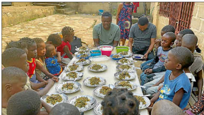
Von Herz zu Herz im Kongo

Es wäre schön, wenn wir den ersten Advent gemeinsam feiern könnten.