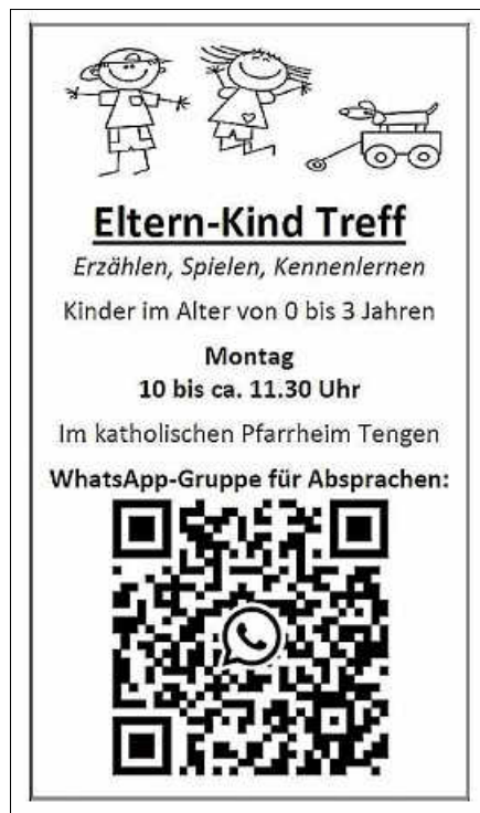
Plakat: SE Tengen