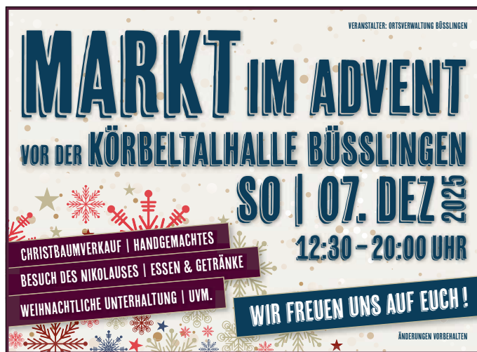
Plakat: Ortschaftsverwaltung Büßlingen

Jeweils in den geraden Kalenderwochen, mittwochs, 19 - 20 Uhr , im Rathaus, Ledergasse 12, Tel.: 250