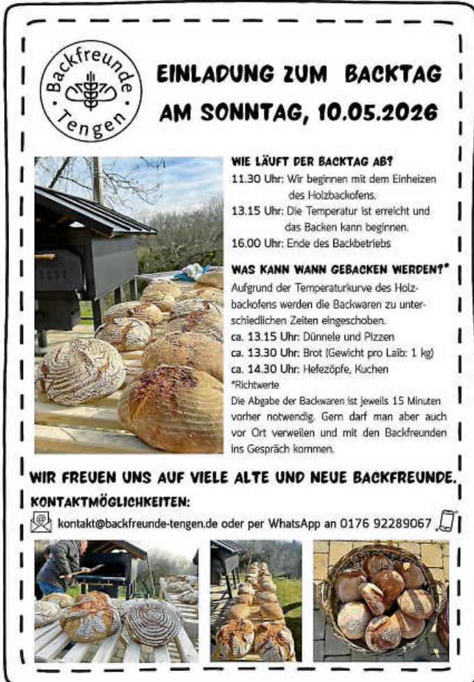
Plakat: Backfreunde Tengen