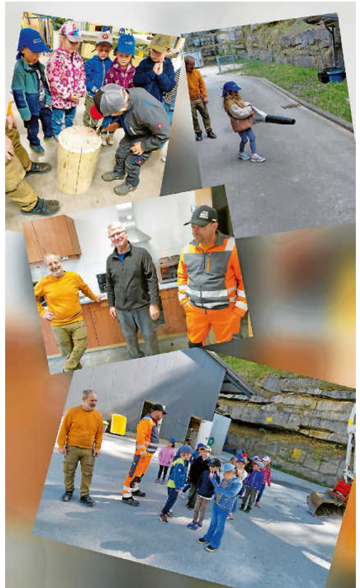
Wackelzähne im Bauhof Tengen

Schaffet's gut, herzliche Grüße von den Wackelzähnen und dem Kita-Team Watterdingen.