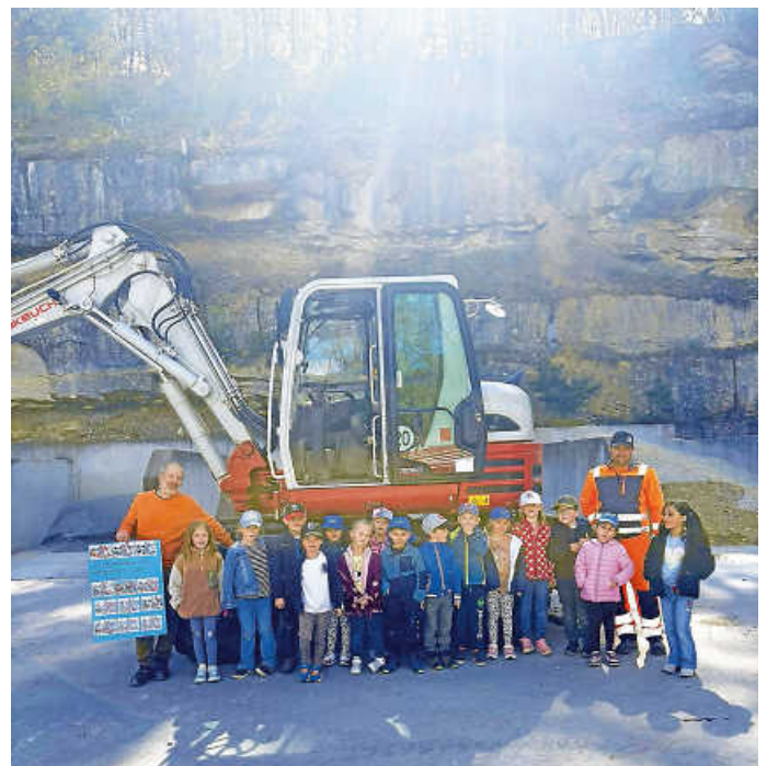
Wackelzähne vor dem Bagger