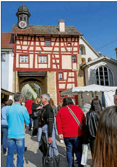
Josefsmarkt 2026 vor dem Städtor

Der Josefsmarkt 2026 zeigte einmal mehr, wie lebendig und beliebt der Tengener Markt ist.