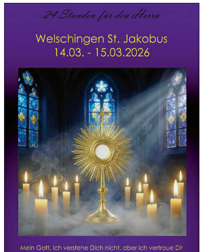
24 Stunden vor dem Herrn