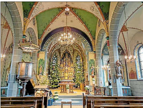
St. Martin Büßlingen

Tel.Nr. 0800-1110111 und 0800-1110222, www.telefonseelsorge.de