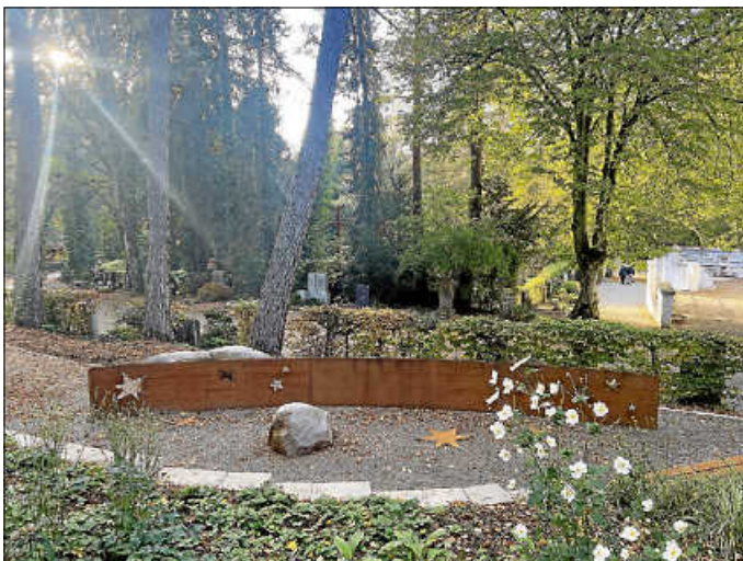
Gedenkstelle auf dem Waldfriedhof in Singen. Es ist ein Ort der Erinnerung für alle Frauen und Männer, die auf ihrem Lebensweg ein Kind verloren haben.