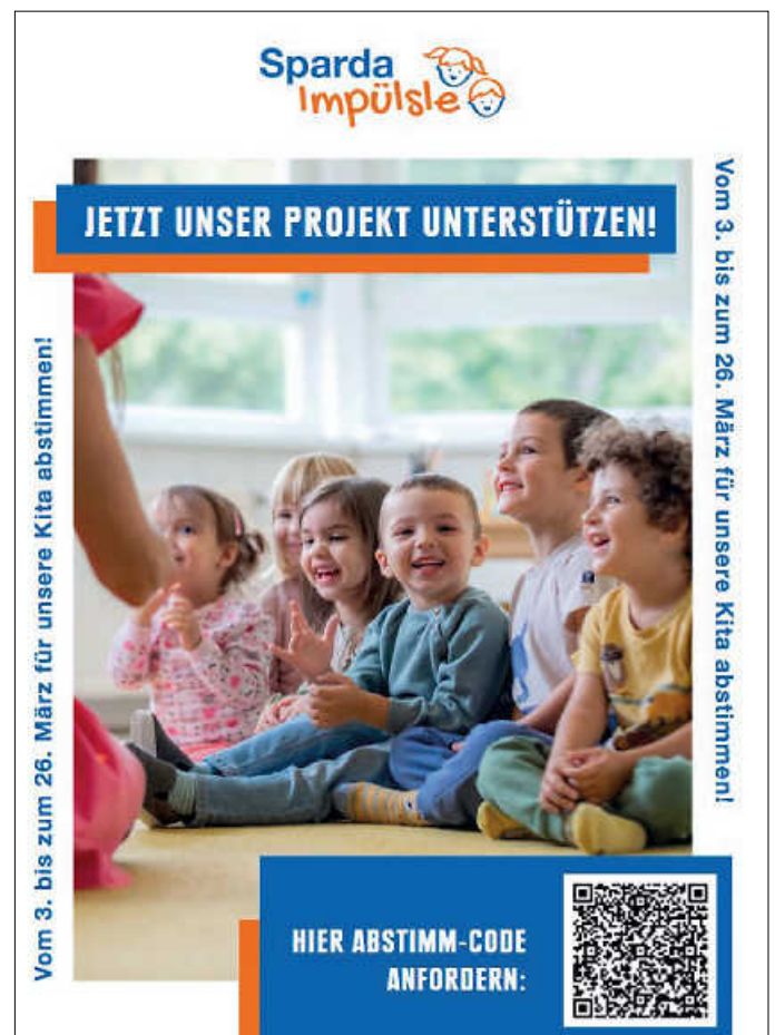
Sparda-Impulsle mit QR-Code