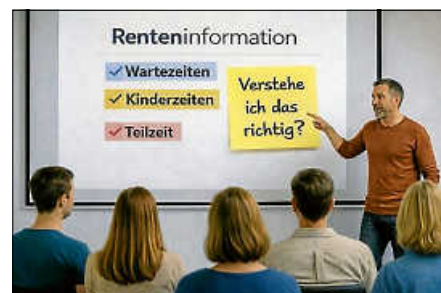
ChatGPT – KI-generiertes Bild

zu einer öffentli- chen Informations- veranstaltung rund um das Thema Ren- te und finanzielle Absicherung ein. Der Vortrag richtet sich an alle Interes- sierten, insbeson- dere an jüngere und mittlere Gene- rationen, die ihre finanzielle Zukunft bewusst einschätzen möchten.