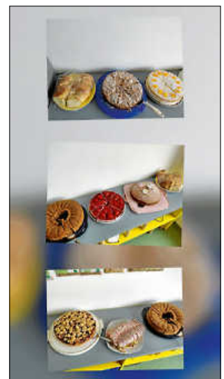
Leckerer selbstgebackener Kuchen für die Großeltern

Ein fröhlicher und herzlicher Nachmittag erwartete die Großeltern in der Kita Watterdingen. Mit dem schwungvollen „Fri-Fra Frühlingslied“ eröffneten die Kinder den Mittag und sorgten gleich zu Beginn für gute Stimmung und ein Lächeln auf den Gesichtern der Großeltern, besonders auch als die Kinder ihnen ihre selbst gebastelten Blumen brachten. Im Anschluss luden wir unsere Gäste zu Kaffee und selbst gebackenen Kuchen ein. In gemütlicher Atmosphäre wurde gemeinsam genossen, erzählt und gelacht. Eine besondere Zeit war die gemeinsame Spielzeit. Kinder, Omas und Opas verbrachten wertvolle Momente miteinander, bauten, spiel-