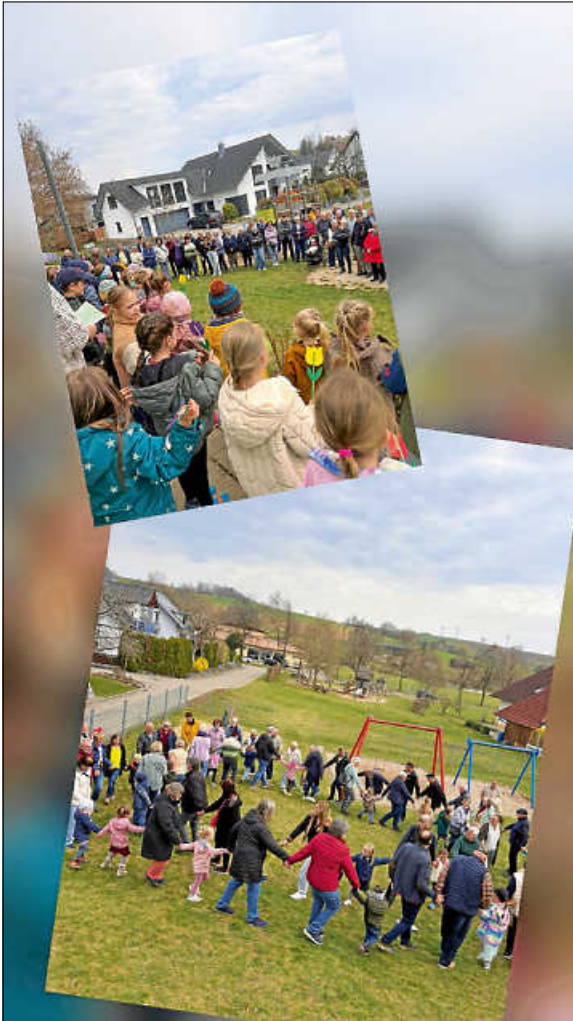
Beginn und Ende des Nachmittags

Herzliche Frühlingsgrüße von den Kindern und dem Kita-Team Watterdingen