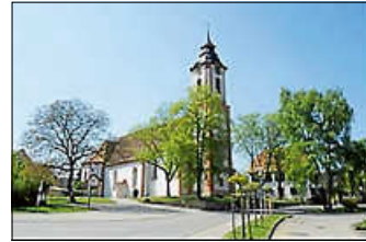
Kirche Watterdingen