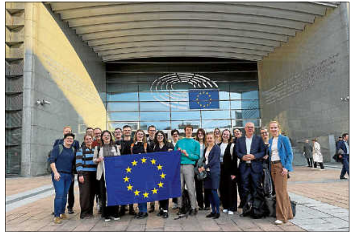
Vertreterinnen und Vertreter der 20 LEADER-Aktionsgruppen aus Baden-Württemberg zu Gast in Brüssel.

Abschluss bildete ein Austausch mit Winfried Schröder, Referatsleiter für Ernährung und Landwirtschaft bei der Ständigen Vertretung der Bundesrepublik Deutschland bei der Europäischen Union.