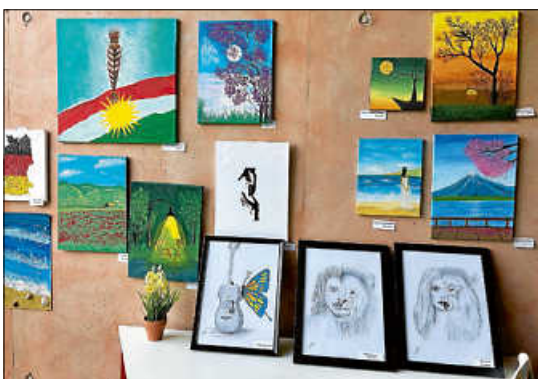
Vernissage mit Gemälden der Teilnehmerinnen des BEF-Alpha 2025-2026

Ein neuer BEF-Alpha-Kurs mit Zielsprachniveau A2/B1 GER begann am 6. April 2026 und richtet sich an Frauen mit ersten Deutschkenntnissen auf A1 GER. Träger der Maßnahme ist die Beschäftigungsgesellschaft Landkreis Konstanz gGmbH (BG). Das vom Ministerium für Kultus, Jugend und Sport Baden-Württemberg ausgeschriebene Projekt wird aus Mitteln des Bundesministeriums für Bildung und Forschung finanziert. Die Weiterfinanzierung steht derzeit auf dem Prüfstand, obwohl das Angebot besonders wichtig für zugewanderte Frauen mit Kindern ist, die erschwerten Zugang zu Unterstützungsangeboten haben.