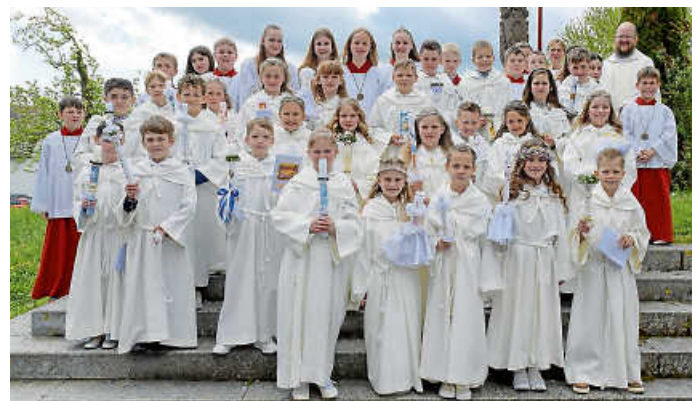
Erstkommunion Tengen 2026