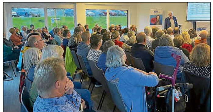
„Großes Interesse beim BürgerTreff des VdK: Die Begegnungsstätte war bis auf den letzten Platz gefüllt.“