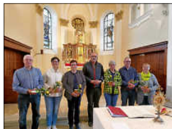
Gemeindeversammlung Wiechs