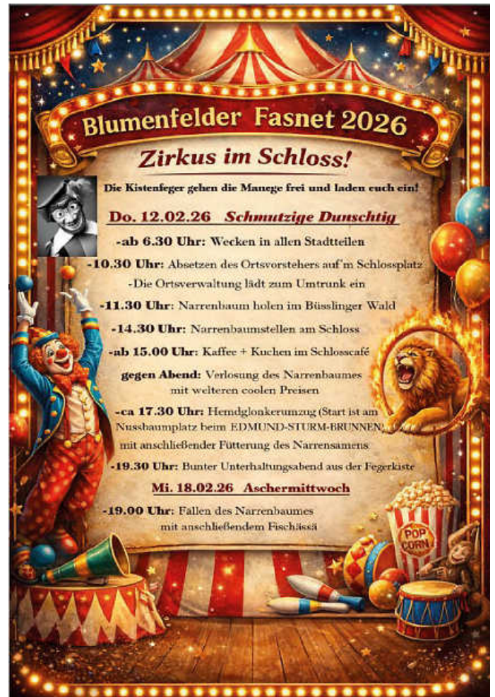
Plakat: Clemens Volk