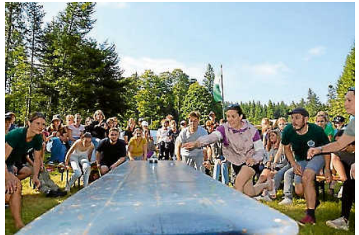
Spiel Spaß am Bockhorn

23.08 – 05.09.2026 LagerLEBEN (für Jugendliche 10-15 Jahre)