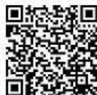
Aktuelle Satzung mit vorgesehenen Änderungen