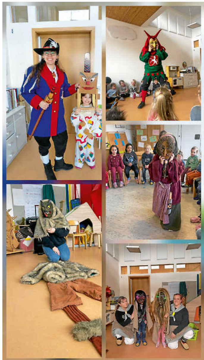
Narrenzünfte in der Kita