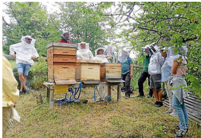
Schnappschuss Kurs 2025

Ein unverbindlicher Infoabend findet am 20.02.2026 um 19 Uhr bei Reinhold Frank, Ob's Herrenhaus 7 in Watterdingen statt.