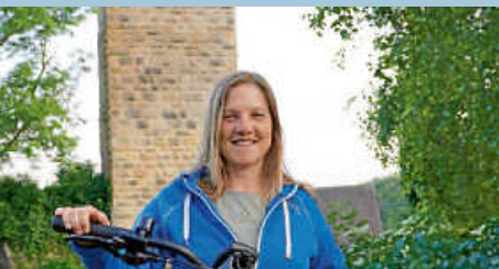
Mystische E-Bike-Führung - Mit Virgin-Power rund um die Einhorn-Stadt Tengen