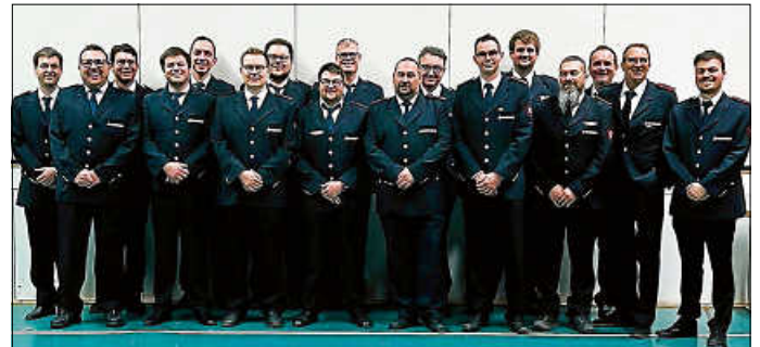
Die Gewählten und Geehrten Kameraden der Abteilung Watterdingen und Weil

Den ausscheidenden Mitgliedern des Abteilungsausschusses wurde für Ihren Dienst gedankt.