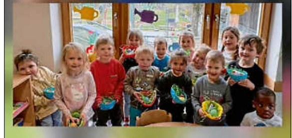
Ostern in der Kita