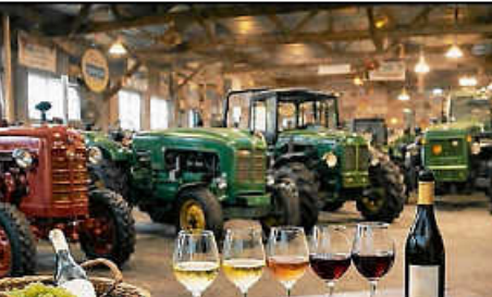
Seniorenausflug am 28.05.2026