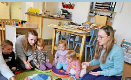
Ei, ei, ei. Die Hühner sind los!