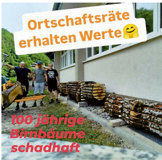
v. l. Ortschaftsräte Ralf Meyer, Markus Feucht und Ralf Korndörfer

Am Samstag haben wir Ortschaftsräte diese beeindruckenden Stämme nun auflagern können.