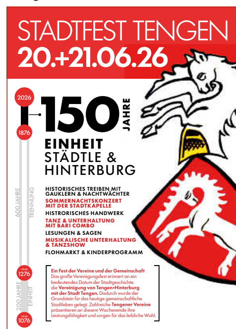
Plakat: Stadt Tengen

Ein musikalischer Höhepunkt des Wochenendes ist das Sommernachtskonzert der Stadtkapelle Tengen am Samstagabend. Mit einem Mix aus Film- und Musikmelodien. Im Laufe des Abends wird es, mit dem Stück „Soar“ aus der Serie „Masters of the Air“, eine Deutschlandpremiere geben. Eigens hierfür wird der Arrangeur Callum Rookes aus England nach Tengen reisen und den Taktstock der Stadtkapelle übernehmen. Das Vereinigungsfest 2026 verspricht somit ein Wochenende voller Begegnungen, Musik, Genuss und Geschichte – ganz im Sinne der Entscheidung vor 150 Jahren, die Tengen und Tengen-Hinterburg dauerhaft miteinander verband.