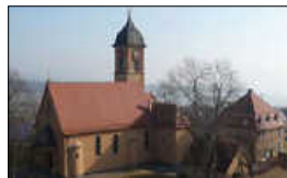
Kirche Wiechs

unser kirchliches Leben vor Ort lebt von uns allen – von Ihrer Stimme, Ihren Ideen und Ihrem Engage-