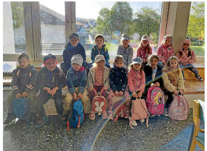
Die Rallye beginnt

Rätselhafte Grüße von den Wackelzähnen und dem Kita-Team Watterdingen