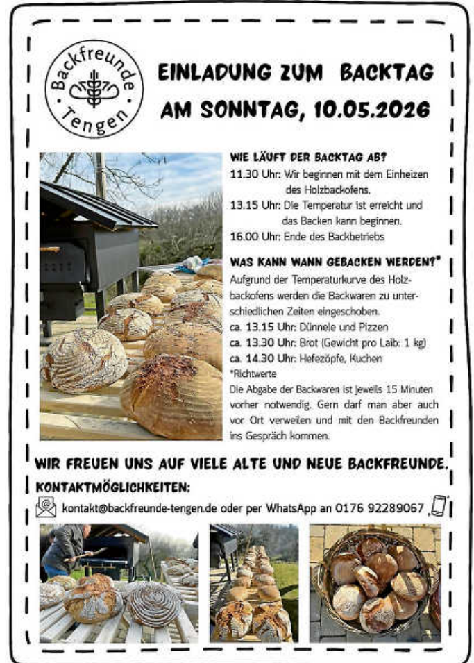
Plakat: Backfreunde Tengen