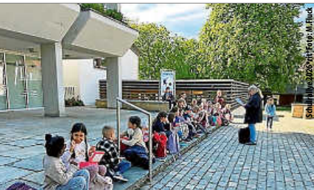
Schulrallye Kita Büßlingen 2026