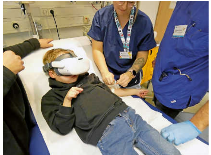
Junger Patient taucht während einer Behandlung in eine virtuelle Welt ab.

Der Gesundheitsverbund Landkreis Konstanz (GLKN) ist ein kommunaler Gesundheitsversorger mit Schwerpunkt auf wohnortnaher, hochwertiger medizinischer Versorgung. Über 3.800 Mitarbeitende versorgen Patienten der Hegau-Bodensee-Region und darüber hinaus – von der Akutmedizin über Vorsorge und Rehabilitation bis zur Pflege von Menschen jeglichen Alters. Mit Kliniken in Konstanz und Singen sowie spezialisierten medizinischen Zentren bietet der GLKN ein breites Spektrum an stationären und ambulanten Leistungen. Seine zertifizierten Fachabteilungen sichern Patientenversorgung auf höchstem Niveau. Die Akademie für Gesundheitsberufe des GLKN trägt aktiv zur Ausbildung und Weiterentwicklung medizinischer Fachkräfte bei. Weitere Informationen: www.glkn.de