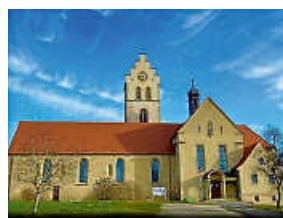
St. Laurentius Tengen

Liebe Gemeindemitglieder , unser kirchliches Leben vor Ort lebt von uns allen – von Ihrer Stimme, Ihren Ideen und Ihrem Engagement. Deshalb laden wir Sie