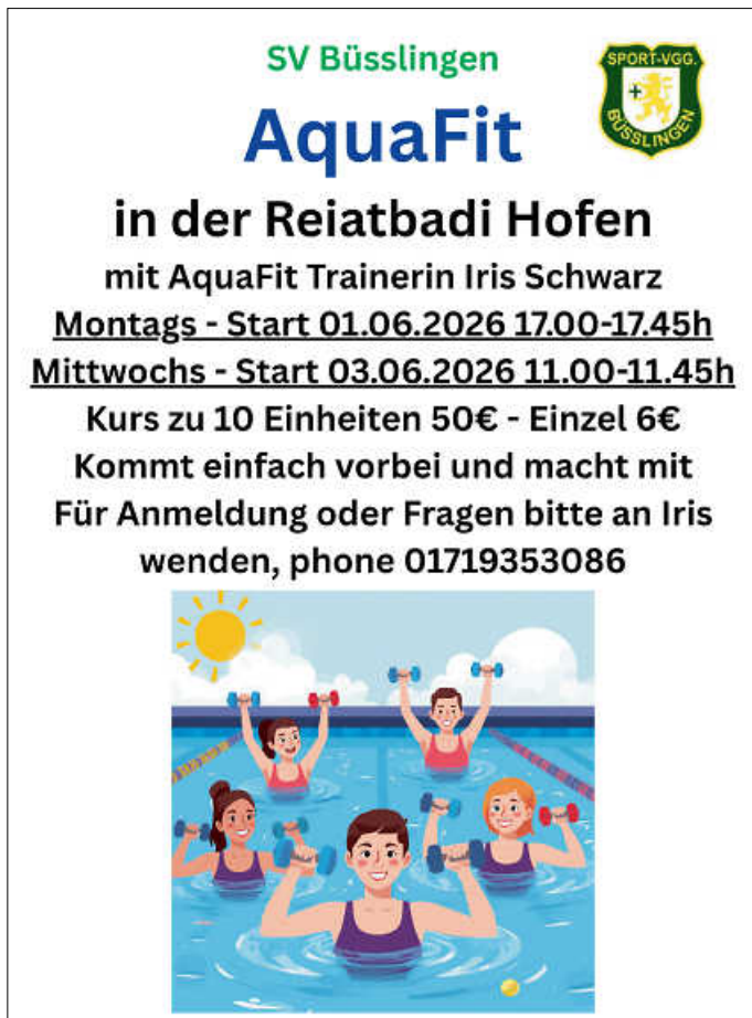
Plakat: SV Büßlingen