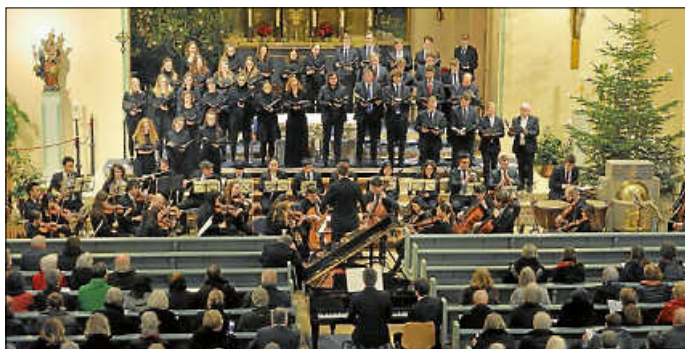
Hochschulchor Trossingen Gottmadingen