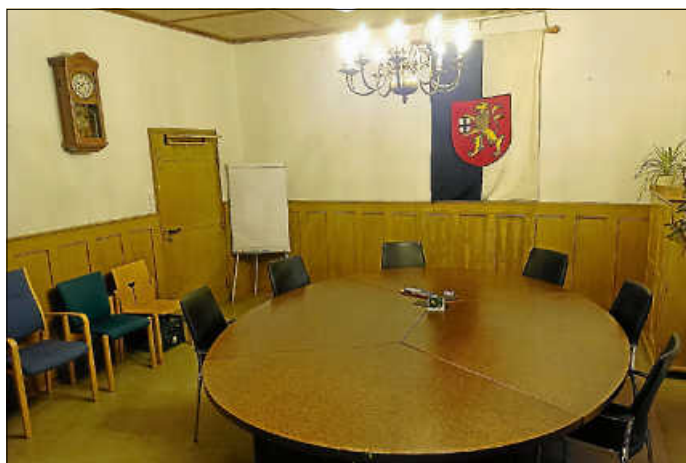
Neues Sitzungszimmer des Ortschaftsrats Büßlingen

Anders als im Vereinskalendar steht, wird die Kulturausschusssitzung am Montag, 10.11. in unseren neu gestalteten Räumen im Rathaus stattfinden.