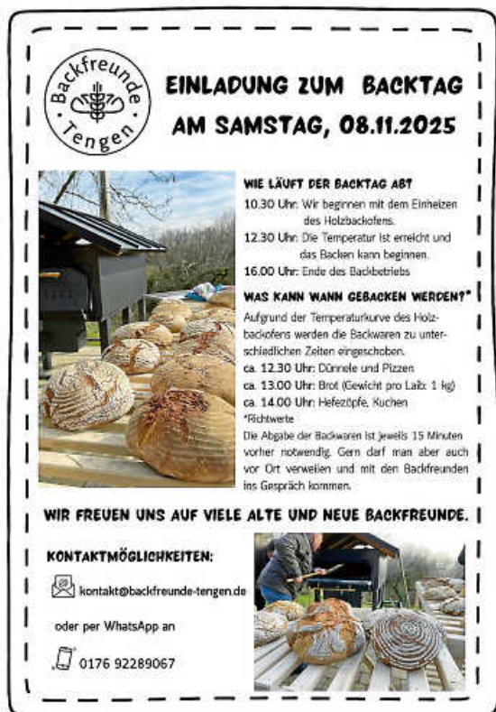
Plakat: Backfreunde Tengen

Die Backfreunde Tengen laden zum Backtag ein.