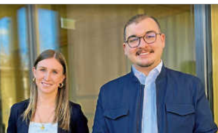
Neue Kollegin in der Verwaltung