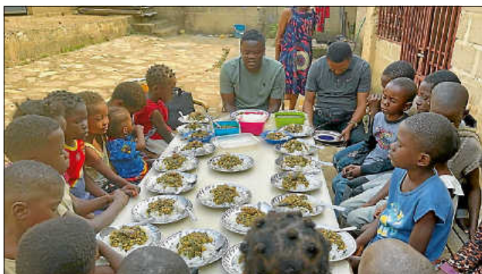
Herz zu Herz Kongo