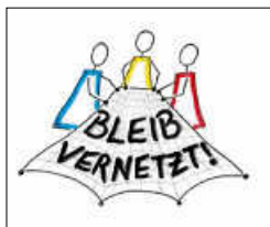
Logo Bleib vernetzt