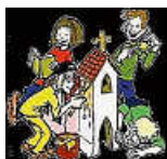
Kinderkirche Tengen

Am Sonntag, 09.11.25 , um 10.30 Uhr wird die Hl. Messe von der Musik-Werkstatt, die dieses Jahr in Tengen vom 07.-09.11.25 stattfindet, mitgestaltet. Das abschließende Kirchencafé lädt zum Austausch mit den Gottesdienstbesuchern ein.