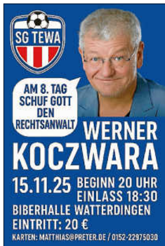
Plakat SG TeWa