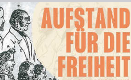
Aufstand für die Freiheit - Aufführung im Schloss