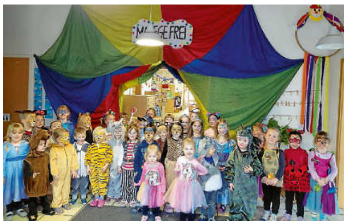
Zirkus, Kita Watterdingen

Manege frei – bei der Fasnacht sind wir dabei.